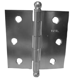
perno suelto cabeza redonda